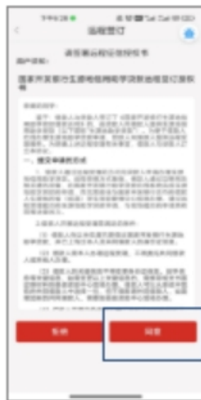
6.同意远程签订合同授权书