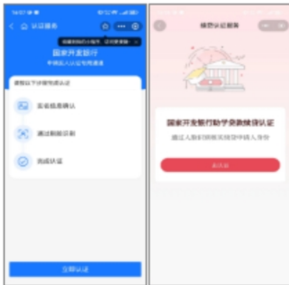
8.跳转至支付宝或代理行APP 进行实人认证