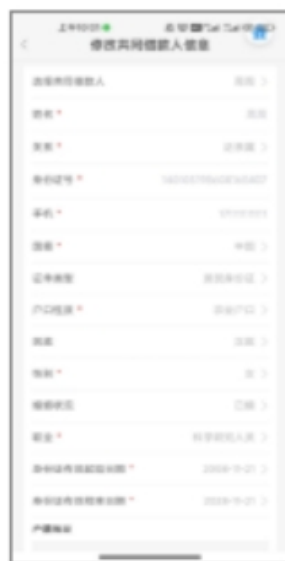
3. 确认共同借款人信息