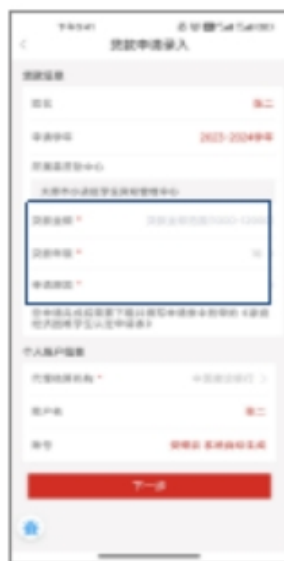
2. 填写贷款金额，选择贷款年限和申请原因