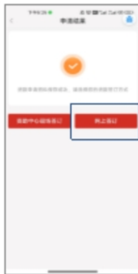
5.选择网上签订合同